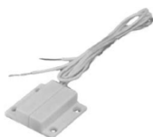
Door Contact 600 119