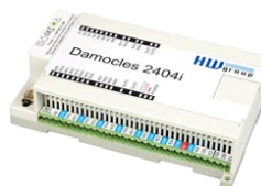
Damocles 2404i 600 374