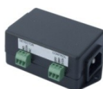
PowerEgg 600 237