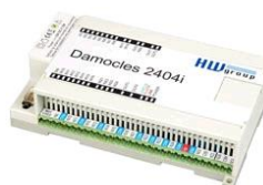
Damocles 2404i 600 374