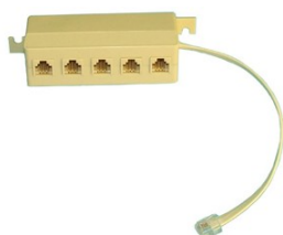
Poseidon T-Box 600 040