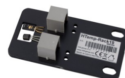
HTemp-Rack19 600 330