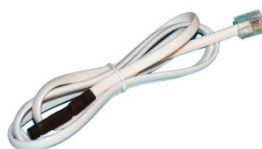
Temp-1Wire 1m 600 242