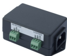
PowerEgg 600 237