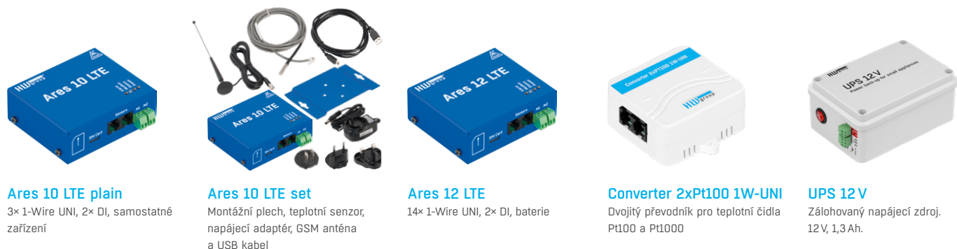
Ares 10 LTE plain 3x 1-Wire UNI, 2x DI, samostatné zařízení