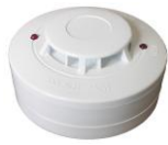
FDR-16-HR teplotní EN54-5

Detektory s výstupem relé určené jako doplněk EZS napájené 12V=