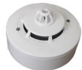
FDR-36-SHR teplotní - kouřový EN54-5,7