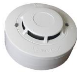
FDR-26-S opticko kouřový EN54-7