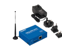
HWg-SMS-GW3 Set SMS brána pro provozování a SMS notifikace přes LAN. Obsahuje anténu a napájecí adaptér.