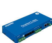
Poseidon2 4002 samotné zařízení.