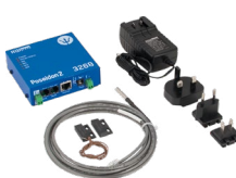
Poseidon2 3268 TSet obsahuje teplotní senzor, dveřní kontakt a napájecí adaptér.