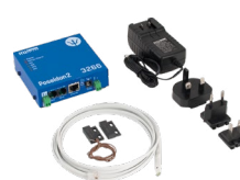
Poseidon2 3266 THSet obsahuje senzor teploty a vlhkosti, dveřní kontakt a napájecí adaptér.