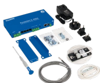
Poseidon2 4002 TSet obsahuje dva teplotní senzory, dveřní kontakt a napájecí adaptér.