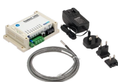
Poseidon2 3468 TSet obsahuje teplotní senzor a napájecí adaptér.